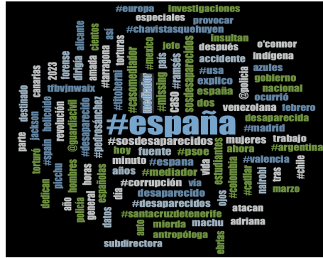
Figura 4. Tabla descriptiva del análisis del hashtag #españa (tabla de elaboración propia)