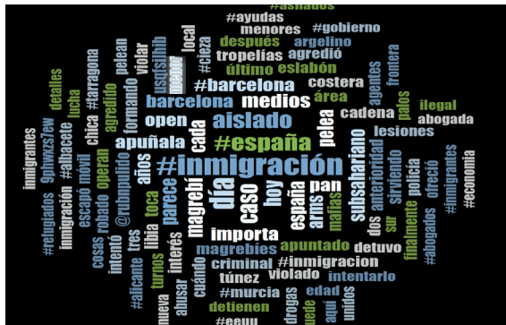
Figura 2. Nube de palabras por frecuencia de palabras y relevancia en base a #inmigración (elaboración propia, agosto 2022)