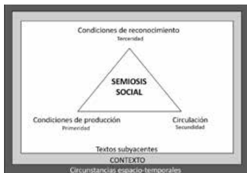
Figura 1. Esquematización de la semiosis social (Verón, 1998)

De acuerdo con Verón (1998), los sistemas significantes son composiciones complejas de las dimensiones propuestas por Peirce: primeridad relativa a la cualidad, segundidad al hecho y terceridad a la ley. Estas categorías ofrecen una estructura analítica operativa y permiten abordar los efectos que producen los signos en la realidad para, en palabras de Peirce (1958c), “hacer eficientes las relaciones ineficientes” (párr. 332), en tanto que remiten a su objeto, lo representan o lo designan; pero, además, a partir de esta relación, se genera un interpretante, una regla de significación conectada con el contexto, la función y sus efectos vehiculizados en discursos sociales (figura 1).