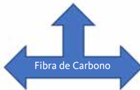
Fig. 6. Esquema de la interfase relaborado hacia la fibra de carbono.

La plantilla de fibra de carbono funciona como interfase porque logra mediar entre el atleta, la zapatilla deportiva y la carrera. De esta forma se establece como el factor constitutivo del utensilio deportivo.