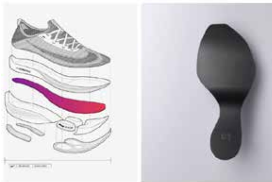
Fig. 1. Ilustración de las zapatillas deportivas Nike Air Zoom Alphafly Next elaborada por Nike.

Para ello, es pertinente la perspectiva semiótica de la moda seguida por Lucrecia Escudero (2020), en la cual la moda no es un sistema , sino un proceso de semiosis cultural . Es decir, cuando se reconoce el proceso de conexiones lógicas en la moda, se permite desarticular los elementos y entender su funcionamiento en la sociedad. Es así que surgen las preguntas: ¿De qué manera repercutió este evento en el diseño de calzado deportivo?, ¿Qué tipo de mecanismos utiliza?, ¿Cómo establece una marca deportiva una moda? El objetivo de este trabajo es presentar una explicación semiótica sobre un evento y un producto deportivo.