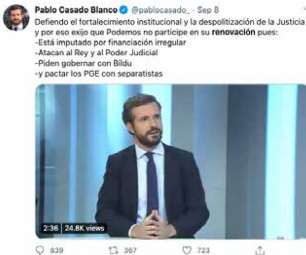
Figura 4. Tweet de Pablo Casado después de su participación en la entrevista en elmundo.es, emitido el 8 septiembre 2020 9 .

Los términos empleados y elegidos para cada fragmento o fracción del discurso, también contribuye a esa acción como intención que hemos detallado y que acabamos de indicar. Particularmente interesante es fijarse en los términos empleados por el sujeto-hablante político y el uso que hace de ellos: