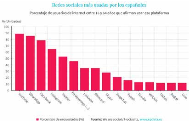
Figura 1. Redes sociales más usadas por los españoles. Fuente: Epdata. Datos actualizados el 25 de septiembre de 2020 4 .

Como nos vamos a referir al caso de España, según algunas estadísticas, las redes sociales de mayor uso en este país son, de mayor a menor, Youtube, WhatsApp, Facebook, Instagram, Twitter, FB Messenger, LinkedIn, Pinterest, Skype, entre otras. En el siguiente gráfico se señalan los porcentajes siguientes: