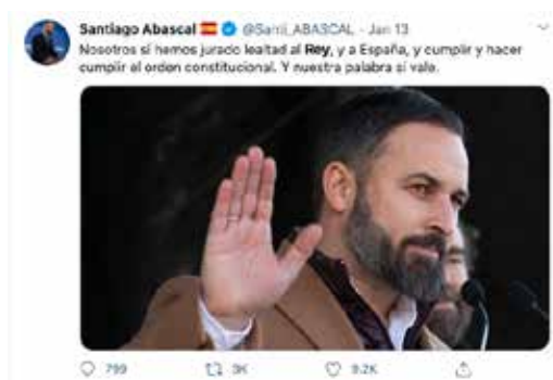
Figura 2. Tweet de Santiago Abascal, de 13 de enero de 2020.

Finalmente, un elemento clave es el código mediante el cual el mensaje se vehicula y que cuenta con el uso de una lengua compartida entre los polos de la comunicación y, además en nuestro caso, el lenguaje sintético del tweet. Respondería a la función metalingüística y que implícitamente quedaría relacionada con la identificación del @nombre del político que emite el tweet o del partido. Un ejemplo: