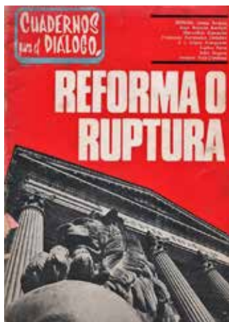
Figura 6. Cuadernos para el Diálogo

Con los años, la institución ha aceptado algunos materiales procedentes de otros repertorios, ha permitido que se acerquen al centro de ese universo semiótico algunos elementos que formaron parte, en su momento, de repertorios alternativos. Sistemas socio-semióticos que, en distintas ocasiones y con mejor o peor resultado, intentaron un cambio de paradigma que nunca se produjo.