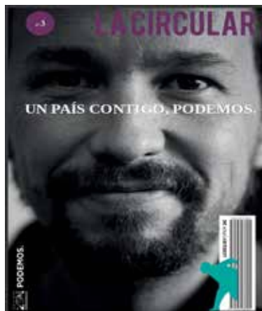
Figura 2. Contraportada La Circular n. 3

No entraremos en cuestiones ideológicas para explicar esta decisión. Nos interesa más analizar los elementos iconográficos que contribuyeron al diseño de la imagen del partido, en un primer momento asimilada a la figura del joven profesor universitario. Su aspecto físico fue escrupulosamente revisado, para evitar el rechazo de algunos sectores de la sociedad. Los asesores de imagen mantuvieron la famosa coleta, seña de identidad irrenunciable, así como su desaliño indumentario , los pantalones vaqueros o las camisas de cuadros compradas en grandes almacenes. Lo que sí suprimieron fue el piercing que adornaba una de sus cejas. Un elemento extremo y demasiado heterodoxo.