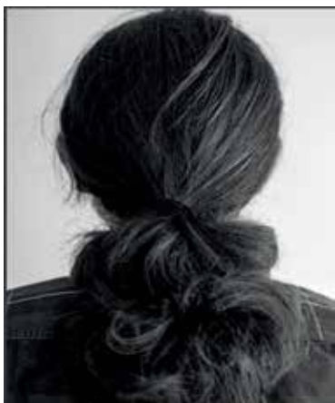
Figura 2. Portada La Circular n. 3