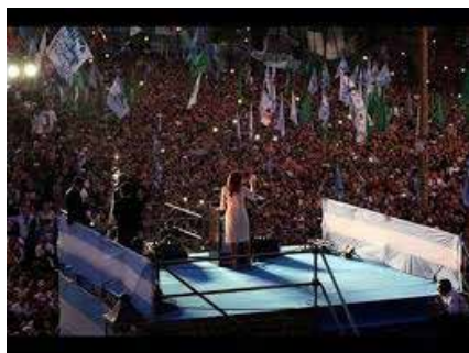
Figura 5. Las Plazas de diciembre I: el discurso de despedida de Cristina Fernández de Kirchner en Plaza de Mayo (9 de diciembre de 2015)(Provincia de Buenos Aires, Argentina, 24 de octubre de 2019)

La relevancia del espectáculo de “paso de mando” cobra sentido cuando se advierte la lógica temporal que subyace y que le da aliento —después de todo, la ceremonia oficial de traspaso de los atributos presidenciales había ocurrido horas antes en el Congreso de la Nación—. Para ello es preciso remontarse al 9 de diciembre de 2015, cuando, en la misma Plaza y ante la misma multitud, CFK pronunció su discurso de despedida, acusando al gobierno entrante de no permitirle entregar el mando. Su legado como mandataria, incluso, fue confiado al pueblo y no a la institución presidencial, a contramano de las reglas habituales del farewell speech (Hall Jamieson y Kohrs Campbell 1991), toda una tradición en otras democracias, pero sin ningún antecedente en la Argentina.