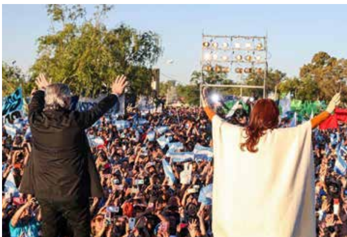
Figura 3. Cristina Fernández de Kirchner y Alberto Fernández en el acto del 17 de octubre (Santa Rosa, Provincia de La Pampa, Argentina)

“El tiempo que se viene es todos juntos, compañeros”: con esas palabras AF iniciaba el tramo final de su alocución en Merlo, durante el acto del 25 de mayo. La frase evidencia una tensión que es constitutiva de la convocatoria amplia, meta-colectiva , del FdT. Con el triunfo electoral en las elecciones primarias, esta se volvería manifiesta en diferentes tramos de la campaña, aunque nunca como en el acto del 17 de octubre, que impone remisiones a la historia del peronismo y, por lo tanto, a la definición misma del colectivo propio: ¿quién es ese nosotros que quiere representar a todos los argentinos? 8