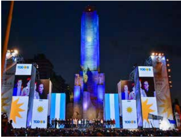
Figura 2. Acto del 7 de agosto de 2019, al pie del Monumento a la Bandera (Rosario, Provincia de Santa Fe, Argentina)

El espíritu de las convocatorias y el diseño de los actos a lo largo de toda la campaña encuentra su complemento en alocuciones cargadas de expresiones del tipo “entre todos”, “todos los argentinos y todas las argentinas”, “todos juntos”, “nadie sobra”, que alimentan la apuesta por elaborar un colectivo de identificación amplio; así, por ejemplo, “necesitamos unir los esfuerzos de todos los argentinos y de todas las argentinas” (CFK, 7 de agosto de 2019), “Acá nadie sobra, todos hacen falta. [...] el tiempo que se viene es todos juntos...” (AF, 25 de mayo de 2019), “Vamos a convocar a todos los argentinos, a todos y a todas, a los que no creyeron en nosotros vamos a pedirles que nos acompañen. No vamos a preguntarles de dónde vienen, vamos a preguntarles si quieren [...] una Argentina justa, una Argentina solidaria [...] (AF, 24 de octubre de 2019). Ninguno alcanza la fuerza del siguiente: