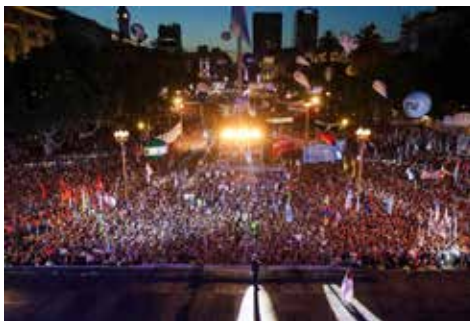
Figura 6. Las Plazas de diciembre II: el acto de asunción de Alberto Fernández en Plazo de Mayo (10 de diciembre de 2019)

Con este marco de situación puede comprenderse mejor por qué cuatro años después CFK teatraliza una entretre de mando que es formalmente irrelevante pero simbólicamente decisiva, sin mácula alguna de la derrota electoral de 2015: