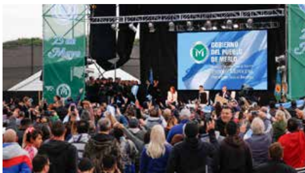
Figura 1. Acto del 25 de mayo de 2019 en la localidad de Merlo (Buenos Aires, Argentina)

Con apenas una diferencia, el primer acto fue realizado el patrio 25 de mayo en la localidad de Merlo, Provincia de Buenos Aires, con motivo de la inauguración del Parque Municipal “Presidente Néstor Kirchner”. La fecha de la Revolución es para CFK una efeméride que condensa —como veremos— memorias colectivas e individuales de variado alcance. A este primero le seguirían el acto del 7 de agosto, previo a las elecciones primarias, abiertas, simultáneas y obligatorias (en adelante, las PASO), al pie del Monumento a la Bandera, en Rosario (Provincia de Santa Fe); el acto del 17 de octubre, en conmemoración al Día de la Lealtad Peronista, en Santa Rosa (Provincia de La Pampa) y, por último, el cierre de campaña en la localidad balnearia de Mar del Plata (Provincia de Buenos Aires), el 24 de octubre.