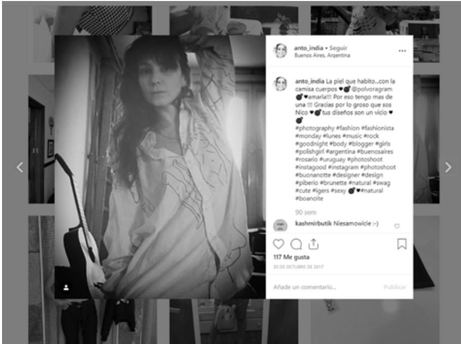
Figura 1. En Instagram, @anto.india etiqueta a la marca “Pólvara” en su publicación sobre su satisfacción por una camisa de la marca.

Las subjetividades del ámbito de la moda en la esfera digital se dirigen hacia otros buscando el reconocimiento en los ojos ajenos y, sobre todo, el codiciado trofeo de ser visto (Sibilia 2008) pero dichas subjetividades se han vuelto inestables, fluidas y temporarias (Haenfler 2014). Las subjetividades postcapitalistas de la moda son muy difíciles de categorizar porque en ellas coexiste la ambigüedad y la contradicción (Kawamura 2016). Algo así como una especie de anomia hibridizada de subjetividades.