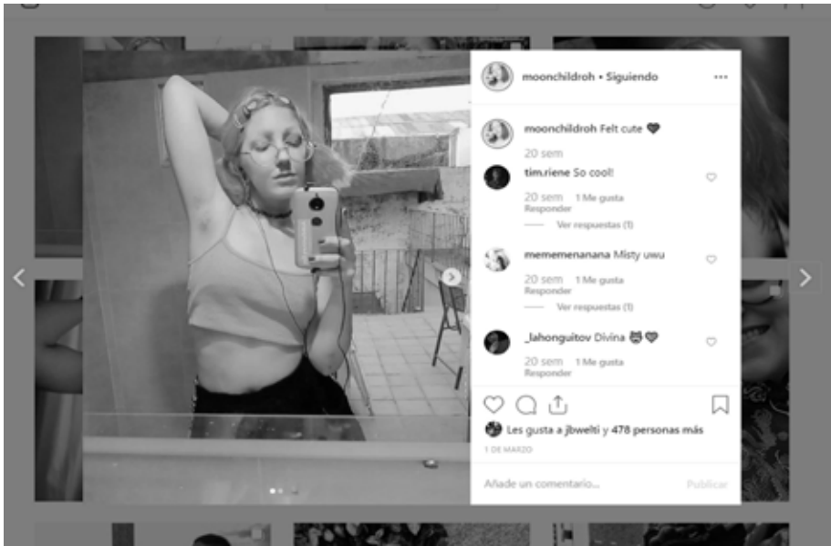
Figura 3. @moonchildroh se expresa como UwU, Kawaii o drag y exhibe su autorretrato mostrando el vello teñido de sus axilas que hace juego con su cabello naranja fluor.

de múltiples estilos, que antes parecían incompatibles, actuando al mismo tiempo y ya no la adhesión ferviente a una única subcultura (Nannini 2018a).