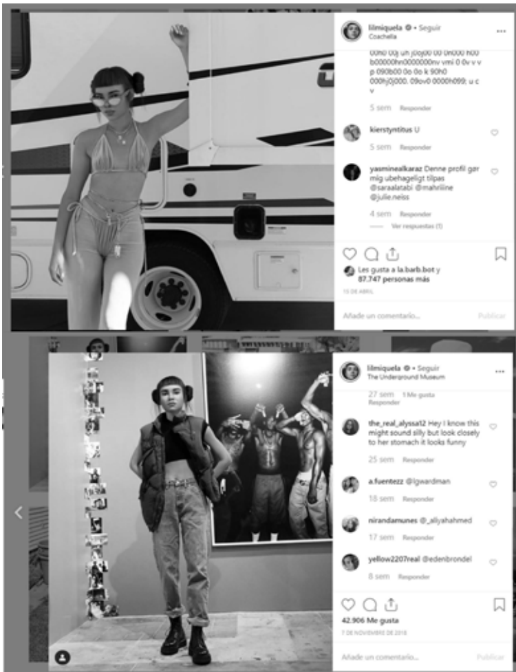
Figura 6. @LilMiquela, figura de referencia hecha con software.

Un caso es el de LilMiquela, modelo digital ficcional que además de vestir indumentaria de Prada, Chanel y Supreme, es una activista social comprometida, incluso hace declaraciones políticas. Su cuerpo responde a nuevos cánones de belleza. Su figura no es extremadamente delgada y tiene poco busto, posee curvas y eso responde a nuevos estereotipos corporales que el mercado ha asumido. En su perfil de Instagram se puede observar que sus creadores han ido modificando su cuerpo, llegando a la forma actual que la torna más real y empática.